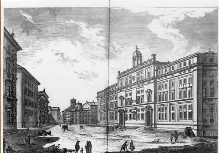
Veduta del Collegio Romano Palazzo Popolo - Chiesa di S. Maria in Via - Chiesa di S. Maria in Via - Chiesa di S. Maria in Via