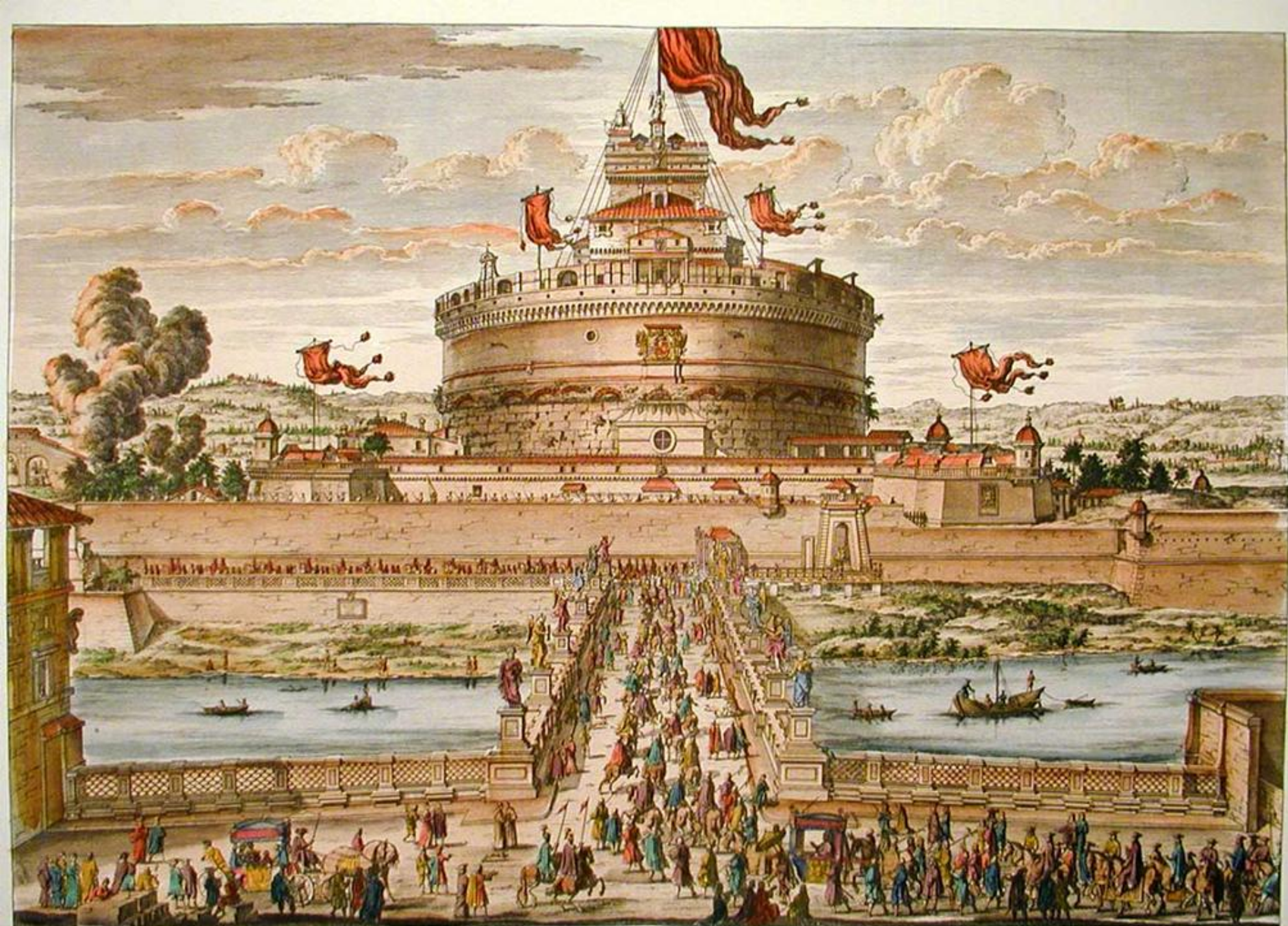
VEUE DU CHATEAU ET DU PONT S T ANGE. à ROME. chez G. de ROSSI. et se vend à AMSTERDAM. chez PIERRE MORTIER. An. 1740.