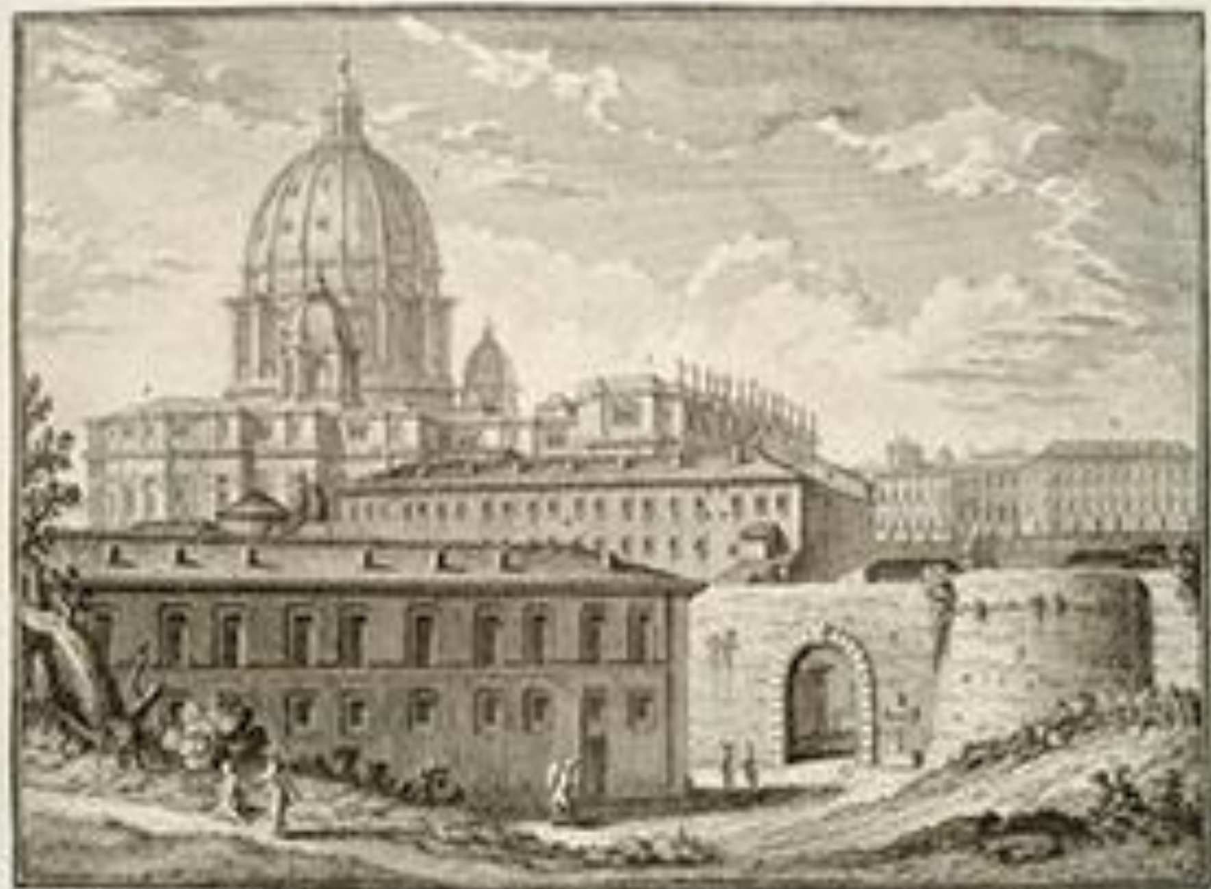
Palazzo Reale in Palermo, Sicily. Engraving by G. B. Piranesi, 1763. From the book 'Vedute di Palermo' by G. B. Piranesi, 1763.